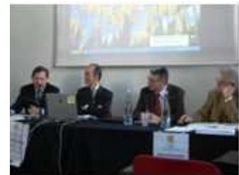
Il tavolo del Consiglio Direttivo del 17 aprile scorso